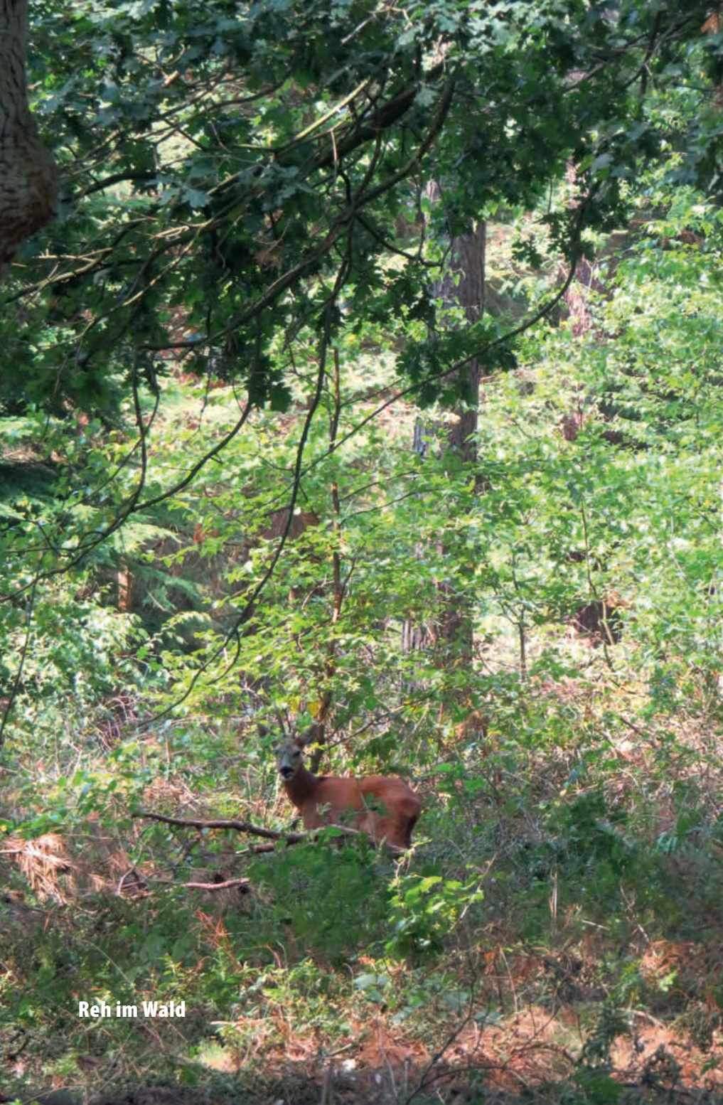
Reh im Wald