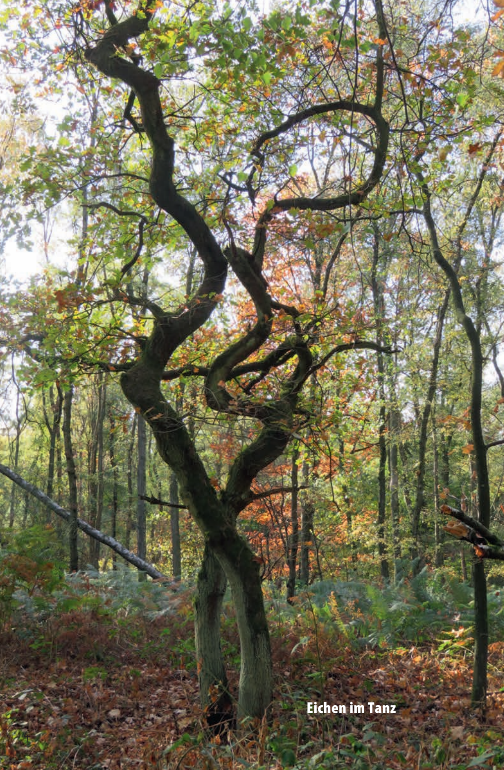
Eichen im Tanz