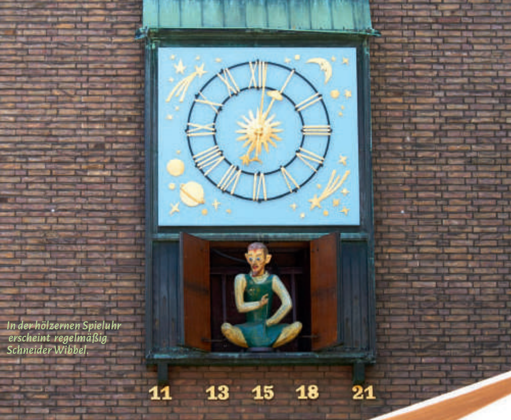
In der hölzernen Spieluhr erscheint regelmäßig Schneider Wibbel.

liche Bürgerhäuser. Sie sind gut auf der Bilker Straße zu erleben, durch die links die Route am Carlsplatz 13 mit seinen Marktständen vorbei in die Berger Straße führt. Im Innenhof Berger Straße 18 liegt versteckt die Berger Kirche, 14 die die erste evangelische (lutheranische) Gemeinde Düsseldorfs errichtete. Der katholische Landesfürst hatte nur den Bau in einem Innenhof zugelassen.