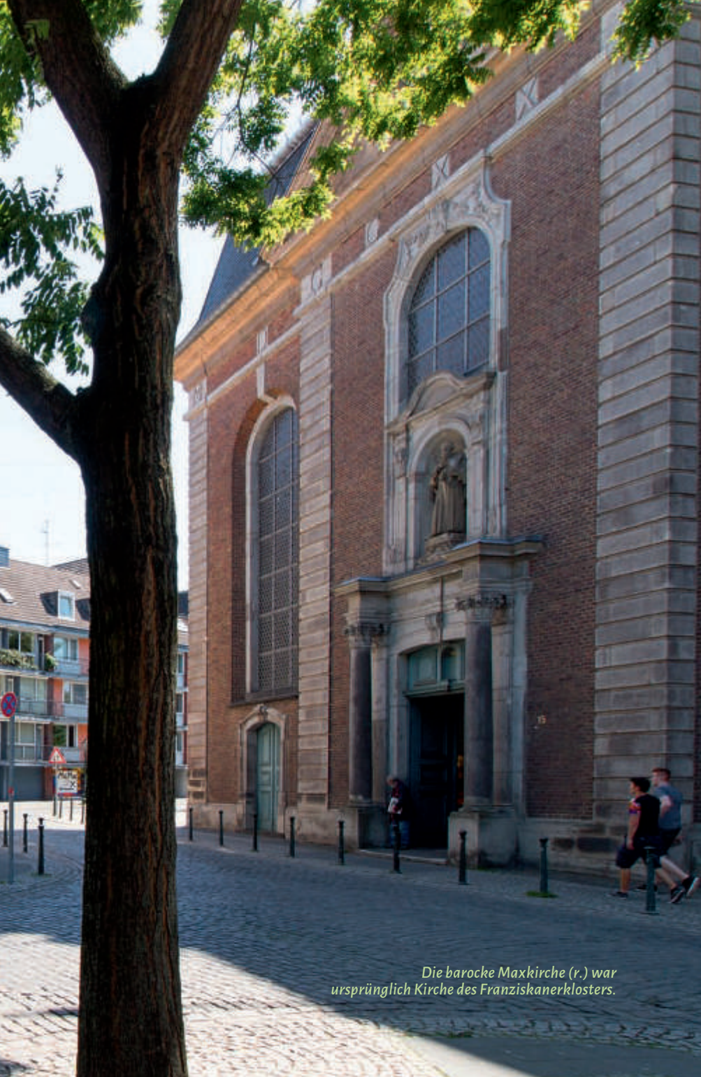
Die barocke Maxkirche (r.) war ursprünglich Kirche des Franziskanerklosters.