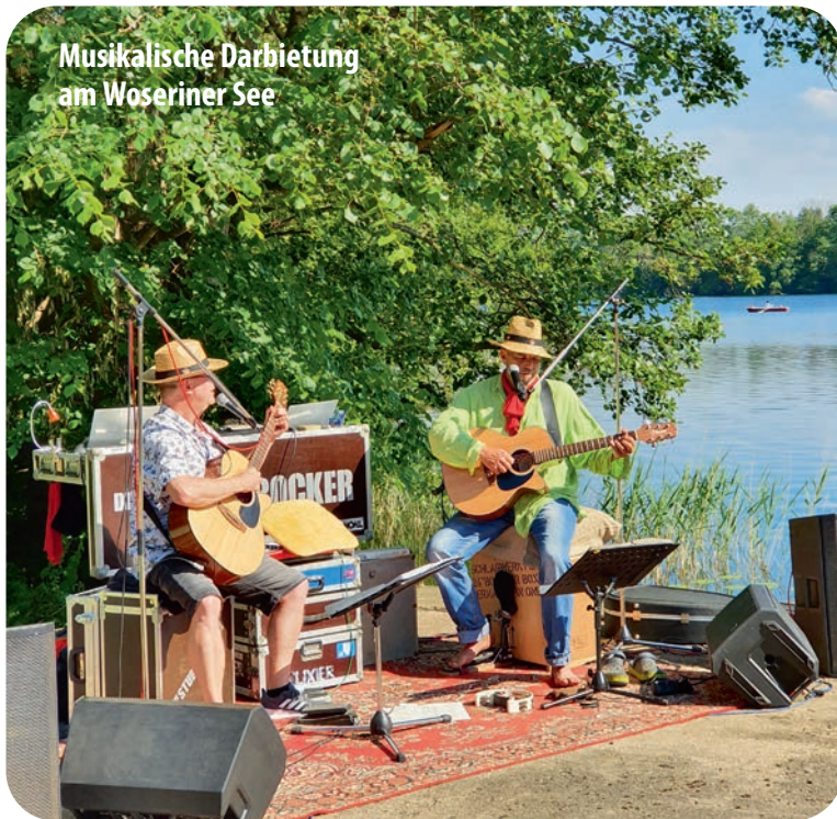
Musikalische Darbietung am Woseriner See

haus am See 11. Einmal im Jahr, zu Pfingsten, ist Woserin Ausstellungsort der landesweiten Aktion KunstOffen. Dann bietet sich ein Blick hinter die Kulissen aller hier lebenden Kunstschaffenden an und es gibt jede Menge regionaler Schlemmereien.