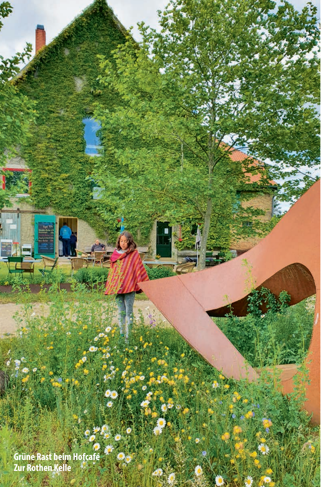
Grüne Rast beim Hofcafé Zur Rothen Kelle