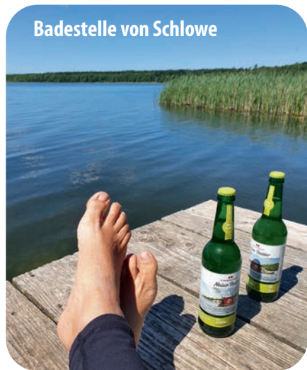
Badestelle von Schlowe

Noch einmal tief durchatmen und den Augenblick festhalten, dann fahren wir die schmale Straße weiter geradeaus bis zum Ortseingang von Borkow . Wir biegen rechts auf die Hauptstraße ab, jedoch nur kurz, denn schon nach gut 600 Metern biegen wir links in eine Straße namens Hof ein, die uns in Richtung Gutshaus Borkow führt. Der Abzweig ist ausgeschildert. Falls