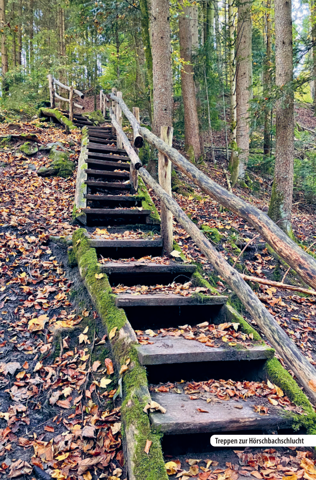
Treppen zur Hörschbachschlucht