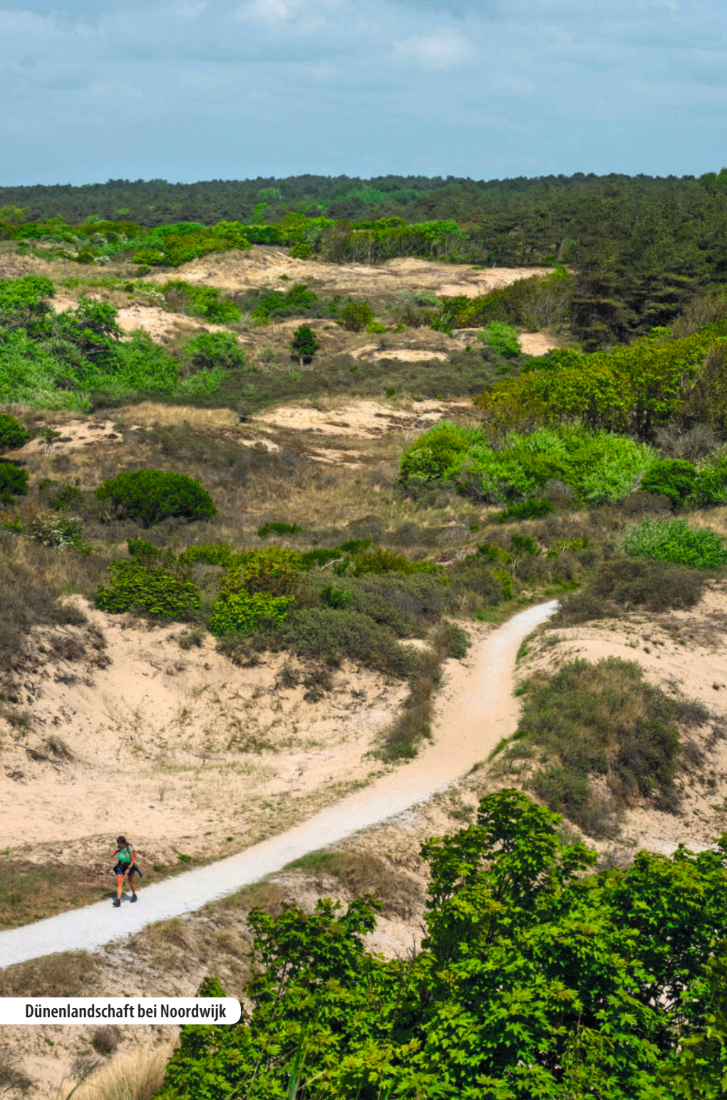
Dünenlandschaft bei Noordwijk