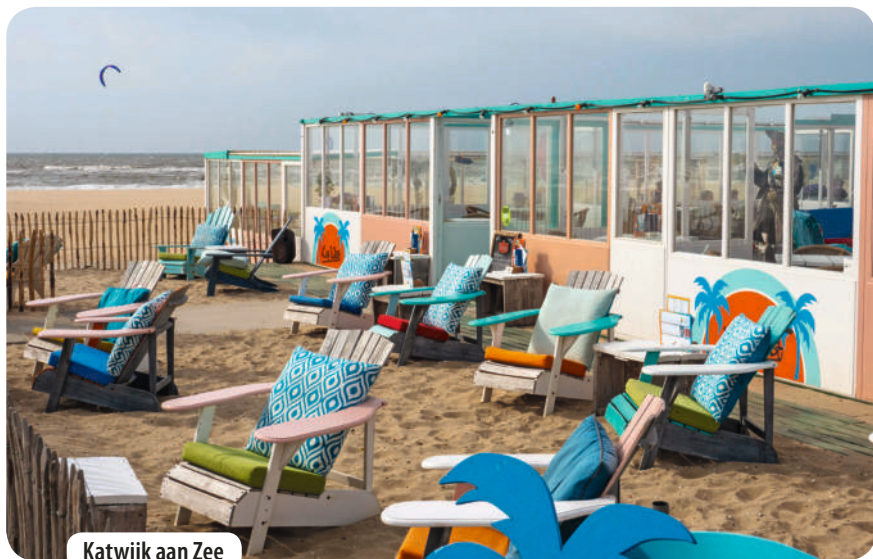
Katwijk aan Zee