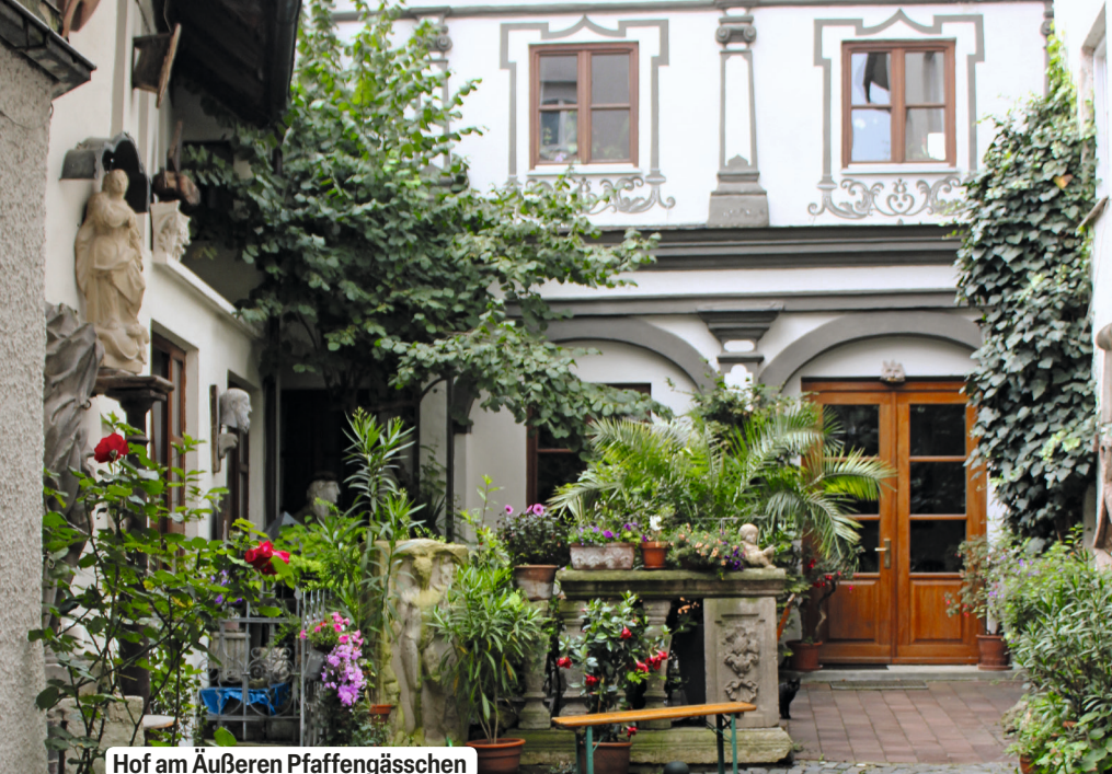
Hof am Äußeren Pfaffengässchen

tatsächlich um einen ummauerten Hof mit Friedhof im Osten, wurde der Ort 1806 zuerst zum Exerzierplatz eingeebnet und schließlich zum Park angelegt. Seitdem steht die Südseite des Domes frei.