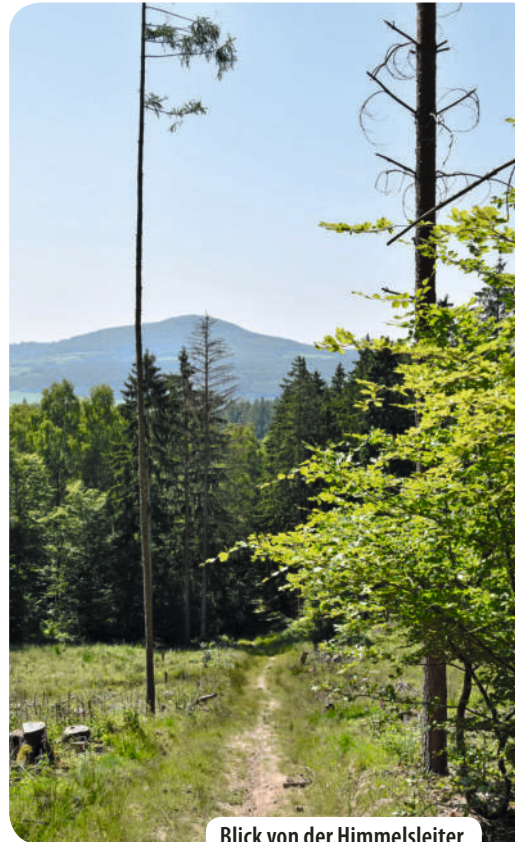
Blick von der Himmelsleiter

Der 645 Meter hohe Pleiß war lange Zeit herzogliches Jagdgebiet, später NVA-Sperrgebiet. 1999 wurde der heutige Pleißturm errichtet. Dies ist bereits der dritte Aussichtsturm. Der erste wurde 1921 aus Holz gebaut und 1936 durch einen Steinturm ersetzt.