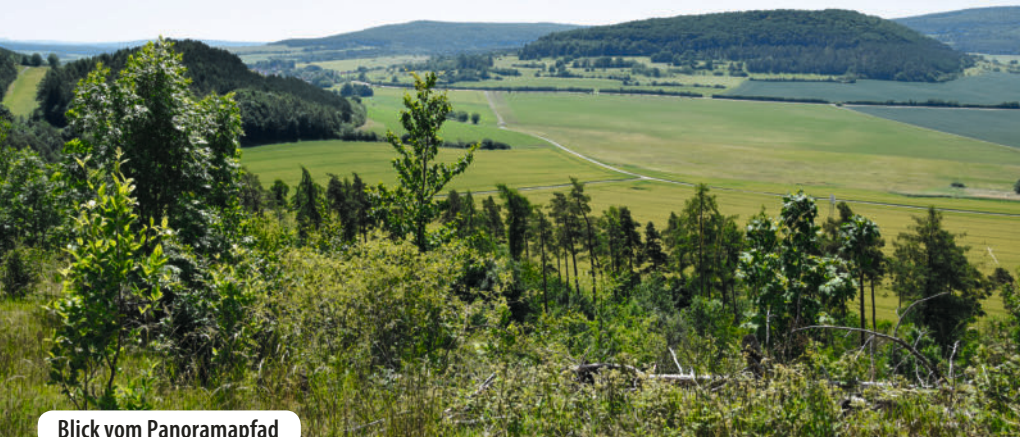
Blick vom Panoramapfad

Gabelung rechts und folgen dem Pfad leicht abwärts. Links begleitet uns der Waldrand, rechts fällt der Abhang beständig ins grüne Tal. Mal müssen wir auf den schmalen 2 Panoramapfad achten, mal schieben sich einzelne Kiefern vor unsere Augen, ansonsten aber bietet der Weg einen einzigen formidablen, berückendenden Blicktaumel. Etwa einen Kilometer zieht sich der Pfad dahin. Dann stoßen wir nach einer steilen Linkskurve auf einen Wirtschaftsweg, wenden uns nach links und nach wenigen Meter erneut links. Am Waldrand zu unserer Linken geht es nun auf bequemem Forstweg ca. 120 Meter weiter bis zu einer Rechtskurve, in der wir den nach links abzweigenden Weg nehmen. Mit einem Rechts-links-Schlenker erreichen wir nach 350 Metern, auf denen es leicht aufwärts geht, die Lichtung, die wir bereits kennen, gehen rechts an ihrem Rand weiter hinauf und genießen erneut die vielleicht gerade blühende Wiese. An ihrem oberen Ende schwenken wir rechts auf einen Weg ein und biegen 200 Meter weiter an einer Abzweigung nach links ab. Bald stehen wir am Waldrand und blicken auf sanft geschwungene Felder und Haine, hinter denen sich der Kegel der Stoffelskuppe erhebt. Ein Grasweg führt uns durch diese Bilderbuchlandschaft