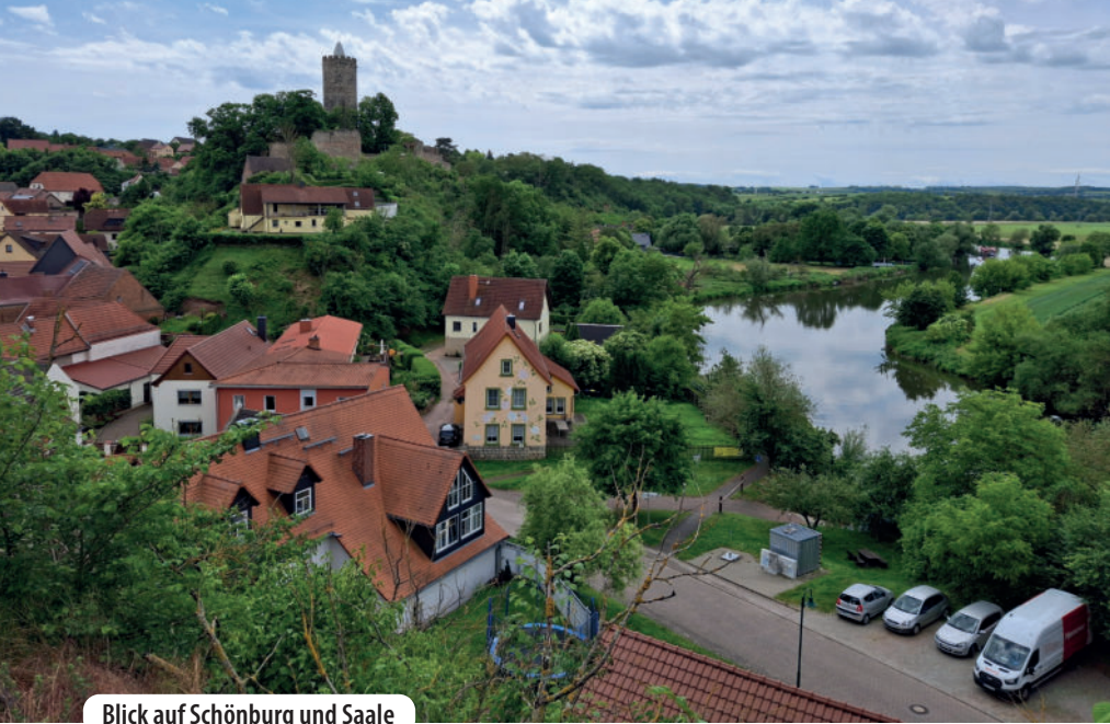
Blick auf Schönburg und Saale

dem Fachberg lädt zum Verschnaufen ein. Bei einem kräftigen Schluck aus der Trinkflasche lassen wir unseren Blick über das malerische Panorama zwischen der Schönburg und der Saale zu unseren Füßen schweifen. Am Horizont ist der Naumburger Dom zu sehen. Sind auf dem Plateau des Fachbergs noch einige Bäume im Weg, so bieten sich an einigen Stellen auf dem 150 Meter langen, schmalen Steig den Hang hinab nach Schönburg unverstellte Blicke. Wer Geologie zu seinen Hobbys zählt, kann sich an zwei Buntsandstein-Aufschlüssen erfreuen, die wir dabei passieren. Doch Vorsicht: Einige der Tritte sind mit Heu gesäumt, sie können schnell rutschig werden. Das Gelände hinterlässt auch einen wackeligen Eindruck. Hier ist also bei allen Schauwerten Aufmerksamkeit gefordert!