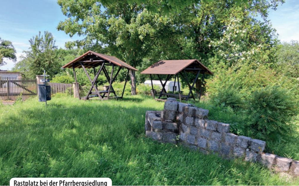
Rastplatz bei der Pfarrbergsiedlung

Pfad eine Koppel passieren. Hier grasen regelmäßig genügsame Pferde, die wir liebevoll streicheln.