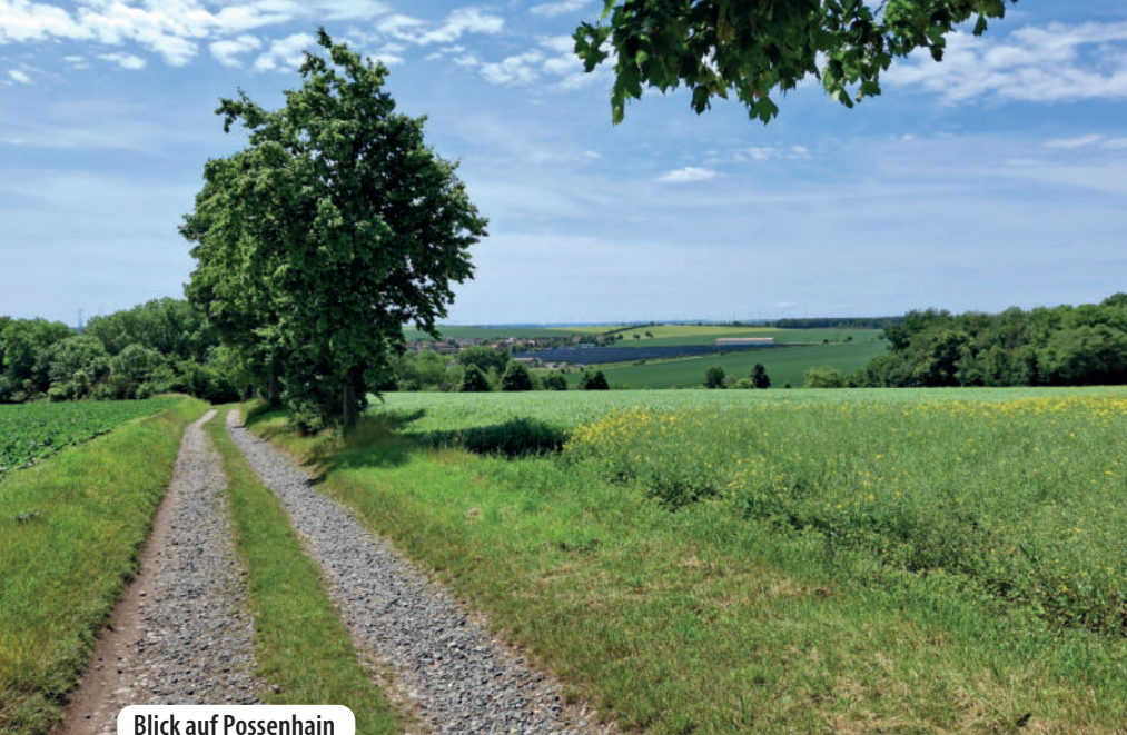
Blick auf Possenhain

schnitt treten wir heraus und erreichen eine asphaltierte Straße. Am gegenüberliegenden Hang können wir mit etwas Glück Schafe beim friedlichen Grasens beobachten.