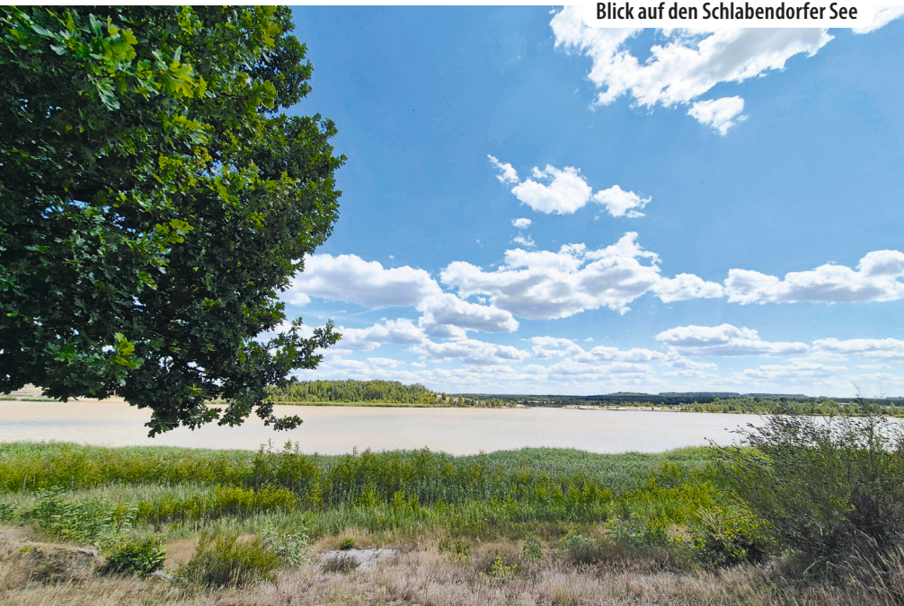
Blick auf den Schlabendorfer See

Kraniche und seltene Fledermausarten begeistern uns im früheren Braunkohleabbaugebiet.