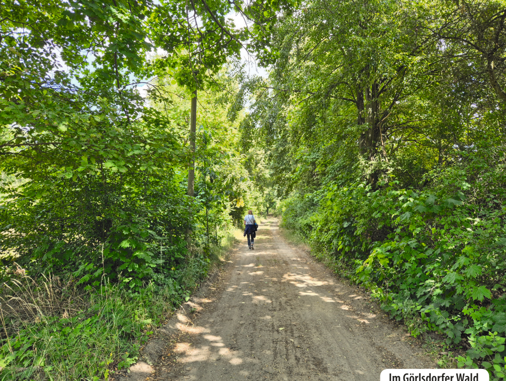
Im Görldorfer Wald

Wiesenwanderweg über. Abseits der nächsten Ortschaften kann man hier ruhig wandern und trifft nur wenige Menschen. In dieser Ruhe können wir die Tiere deutlich besser wahrnehmen. Von den in Brandenburg lebenden 19 Fledermausarten sind hier im Wald zwölf anzutreffen. Die dunklen Fledermauskästen, die an den Bäumen befestigt sind, bieten den teils vom Aussterben bedrohten und streng geschützten Insektenjägern neben Baumhöhlen in kalten Nächten einen sicheren und warmen Schlafplatz und einen Raum für die Jungenaufzucht. Aber auch viele unterschiedliche, teilweise seltene Käferarten wie Eremit, Hirschkäfer und Großer Heldbock lassen sich aus nächster Nähe bestaunen.