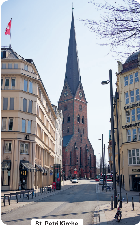
St. Petri Kirche

1195 als Marktkirche erwähnt, die zu einer westlich der Hammaburg gelegenen Händler- und Handwerkersiedlung gehörte. Um 1310/20 entstand ein prächtiger Neubau: eine dreischiffige gotische Hallenkirche. Ihr linker bronzenener Türgriff mit Löwenkopf am Hauptportal gilt als das älteste Kunstwerk Hamburgs und zeugt von der Grundsteinlegung des Turms im Jahre 1342. Die Backsteinhalle wurde 1418 noch um ein zweites Seitenschiff erweitert. Und sogar Pferde fanden darin Anfang des 19. Jahrhunderts Platz, als während der dramatischen Jahre