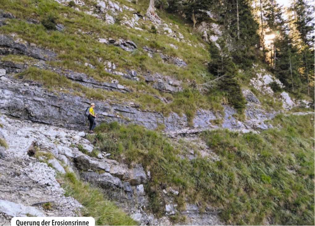
Querung der Erosionsrinne