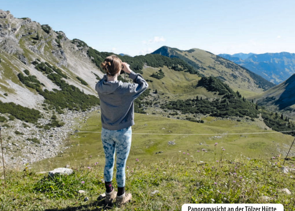
Panoramansicht an der Tölzer Hütte

begehrt. Die über 100 Jahre alte Schutzhütte hat neben der Panoramaterrasse auch einen rundum verglasten Speiseraum, aus dem man auch bei kälteren Temperaturen das grandiose Karwendelpanorama im Süden genießen kann. In Richtung Osten blicken wir auf die Südseite des Schafreuters, im oberen Teil sind einzelne, teils gefaltete Bänder freigelegt. Auf den steinreichen Wiesen unterhalb des Sattels und des Delpsjochs können wir mit etwas Glück Murmeltiere und Gämsen beobachten.