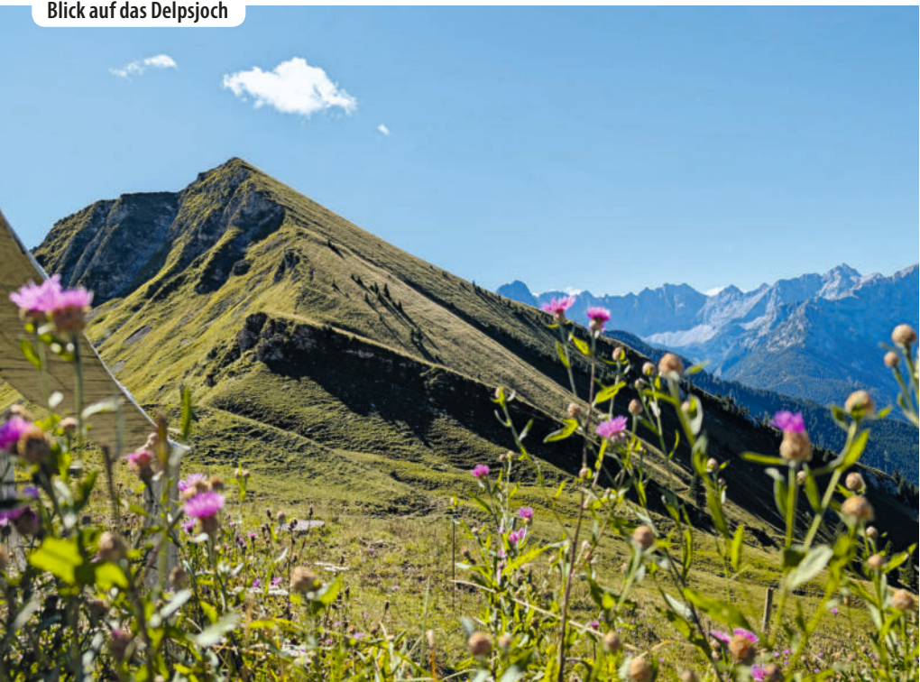
Blick auf das Deljsjoch

hohen Schafreuter zur Linken und dem 1945 Meter hohen Deljsjoch zur Rechten liegt. Neben der Sonnenterrasse befindet sich ein Gewächshaus , im Sommer leuchten Blumen rund um die Hütte in allen Farben, die einladende Holzliege auf der Terrasse ist heiß